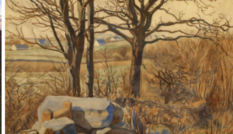
7 Fritz Syberg: Stenten i Svanninge . Tornehave. 1901.

Solnedgangen på Aftenleg i Svanninge Bakker kan læses symbolsk som en melankolsk afslutning på en epoke.