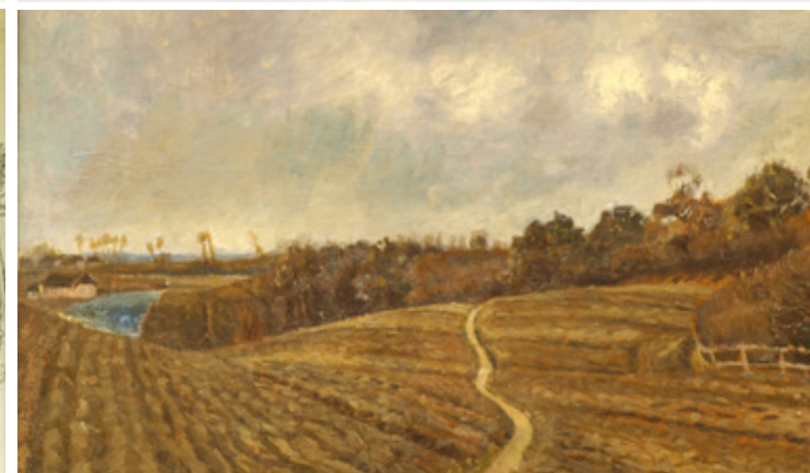
9 Fritz Syberg: Stien til Svanninge . 1892.

I Pumpemagergaarden i Svanninge boede familien Syberg til leje som nygifte i 1894. Senere købte familien Poppelhuset overfor, som siden gik i arv til datteren og svigersønnen Harald Giersing.