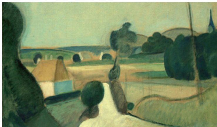
5 Harald Giersing: Landevej til Svanninge . 1919.

Motivet er et karakteristisk for Jens Birkholm, som er lykkedes med at fange lyset under de grå skyer.