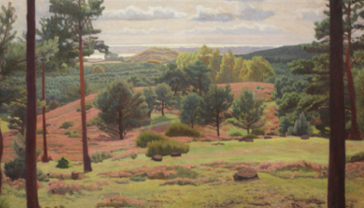
1 Jens Birkholm: Udsigt over Svanninge Bakker . 1912.

Birkholm formår at skabe dybde og rum i værket ved at lade vores blik glide ned over bakkeformationerne for til sidst at ende ved havets flade, rolige horisontlinje.