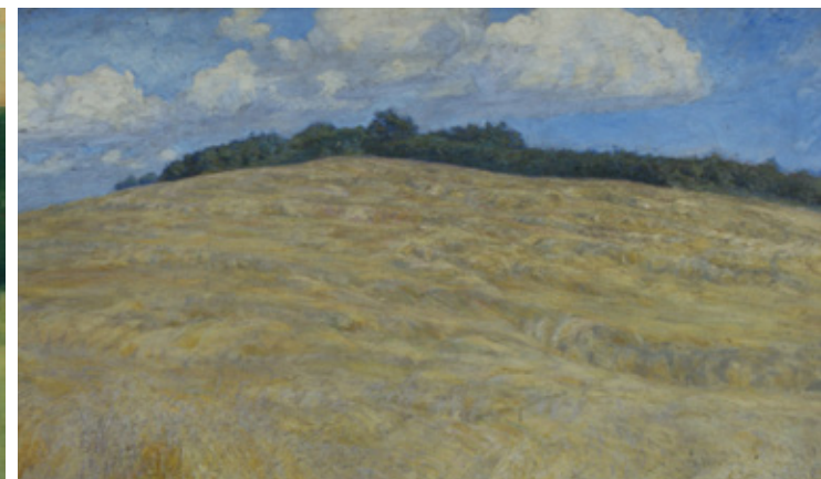
8 Peter Hansen: Moden rug . 1891.

På billedet ses Svanningevej, hvorfra Harald Giersing har malet et af sine mange motiver med Svanninge Kirke.