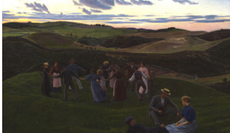
4 Fritz Syberg: Aftenleg i Svanninge Bakker . 1900.

Birkholm formår at skabe dybde og rum i værket ved at lade vores blik glide ned over bakkeformationerne for til sidst at ende ved havets flade, rolige horisontlinje.