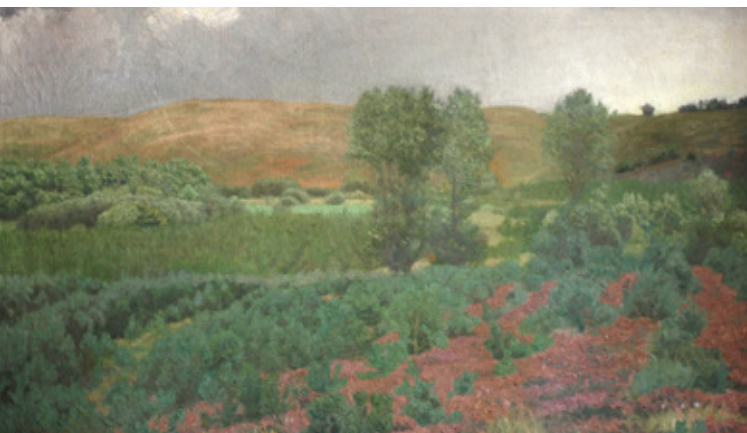
2 Jens Birkholm: Uvejr over Svanninge Bakker . 1905.

De fine støvede blå skygger på træstammer, stendige og hustage er med til at fremhæve oplevelsen af vinterkulden og -lyset.