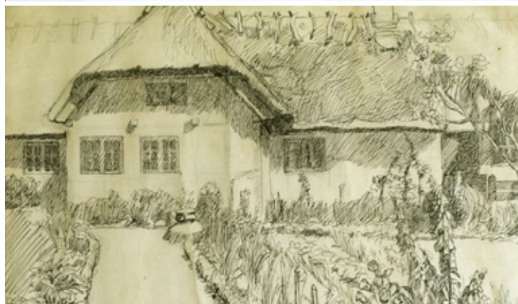
6 Fritz Syberg: Kunstnerens bolig i Svanninge . 1896.